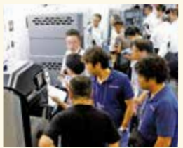
前回(2019年)の会場風景